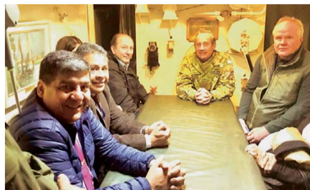
LA INVESTIGACIÓN SOBRE LA SUERTE DEL SUBMARINO, QUE HABÍA PARTIDO EL 13 DE NOVIEMBRE DE USHUAIA Y SE DIRIGÍA A SU BASE EN MAR DEL PLATA CUANDO SE PERDIÓ SU PISTA, APUNTABA DESDE HACE VARIOS DÍAS A ALGÚN TIPO DE FALLA MECÁNICA.