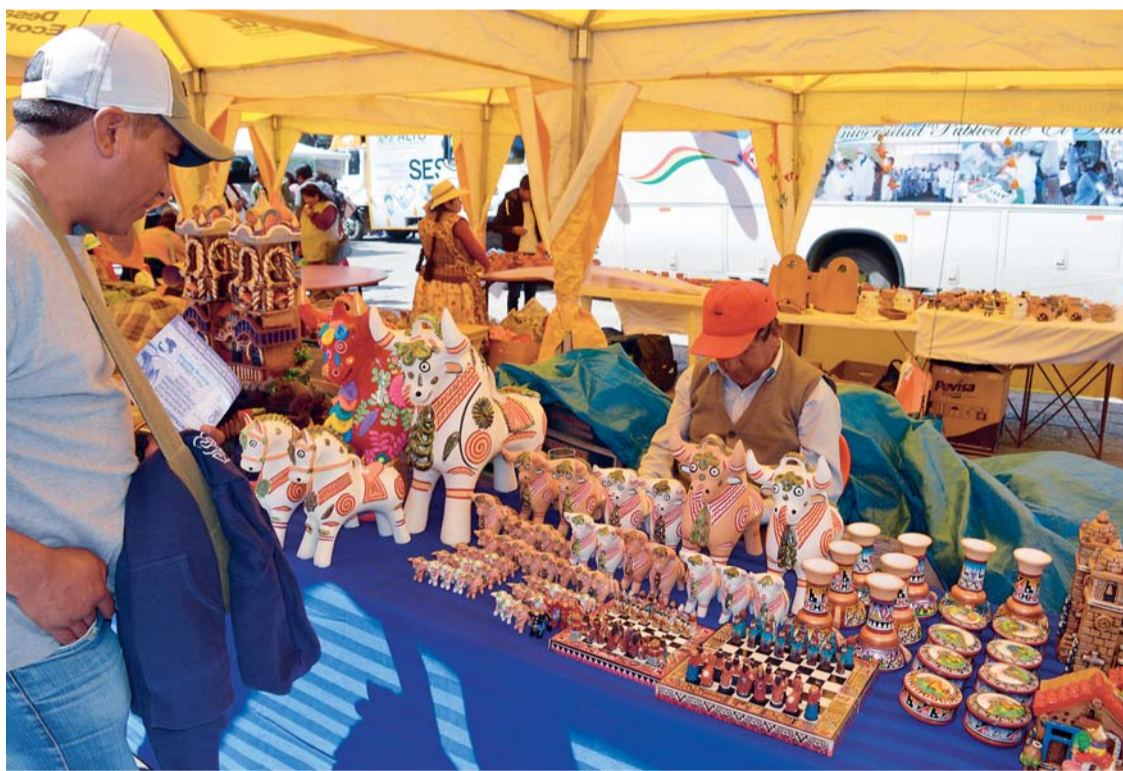
REPRESENTANTES DE OCHO PAÍSES SUDAMERICANOS PARTICIPAN DEL ENCUENTRO DE CERÁMICA, DONDE COMPARTEN CONOCIMIENTOS Y EXPERIENCIAS EN EL RUBRO.