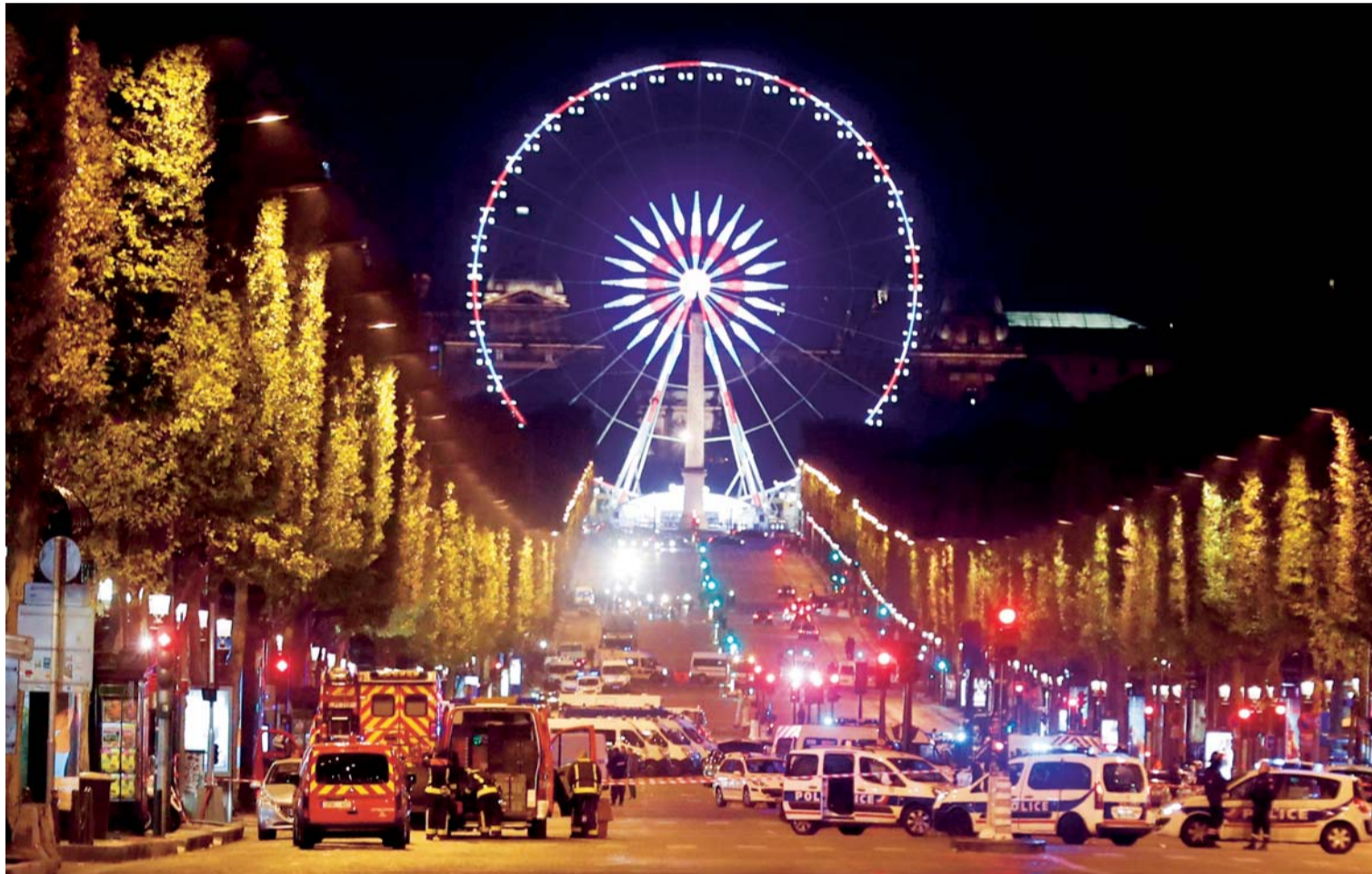
LOS CAMPOS ELÍSEOS DE PARÍS FUERON CERRADOS AL TRÁFICO Y EVACUADOS. UN IMPORTANTE DISPOSITIVO POLICIAL FUE DESPLEGADO EN LA ZONA, ANTE LA POSIBILIDAD DE QUE EL ATACANTE CONTARA CON EL APOYO DE CÓMPlices. LA ACCIÓN TERRORISTA DEJÓ UN SALDO DE DOS MUERTOS Y TRES HERIDOS.

A pocos días de las elecciones presidenciales en Francia, un policía perdió la vida ayer en los Campos Elíseos de París, en pleno corazón turístico y comercial de la ciudad, en un atentado reivindicado por el grupo yihadista Estado Islámico (EI) y el autor del crimen fue abatido por otros agentes.