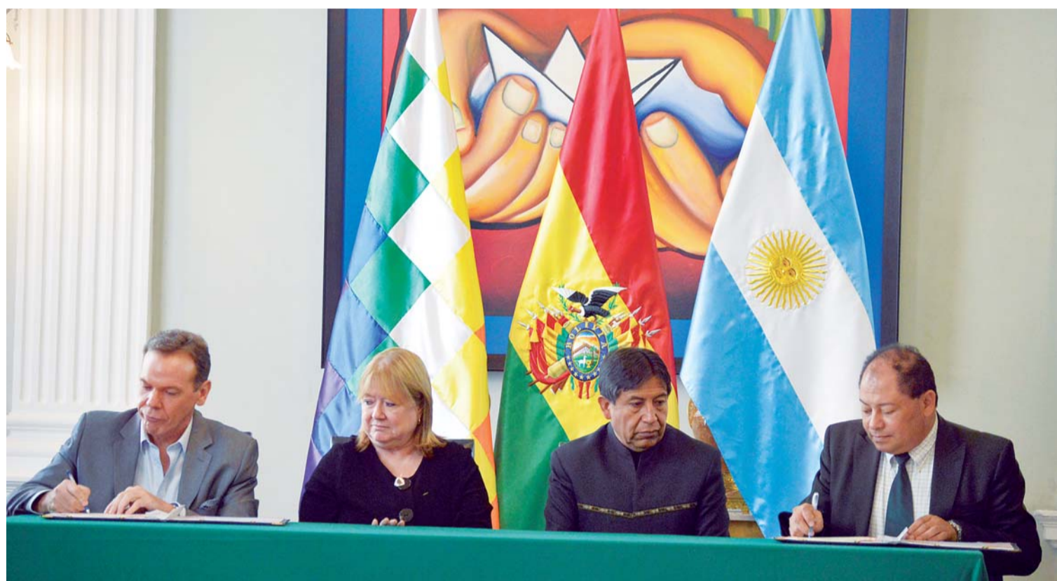
EL CANCELLER DAVID CHOQUEHUANCA (C) Y LA CANCELLER DE ARGENTINA, SUSANA MALCORRA, SUSCRIBIERON UN CONVENIO. EL TEMA MIGRATORIO FUE FIRMADO POR EL MINISTRO CARLOS ROMERO (D) Y EL REPRESENTANTE DE MIGRACIÓN DEL GOBIERNO ARGENTINO.

• Cancilleres de ambos países firmaron una declaración conjunta para trabajar en temas de control migratorio, contrabando, narcotráfico y trata y tráfico de personas. Además, se anunció que el 10 de marzo, autoridades bolivianas y argentinas se reunirán para tratar el tema de la integración de la matriz energética