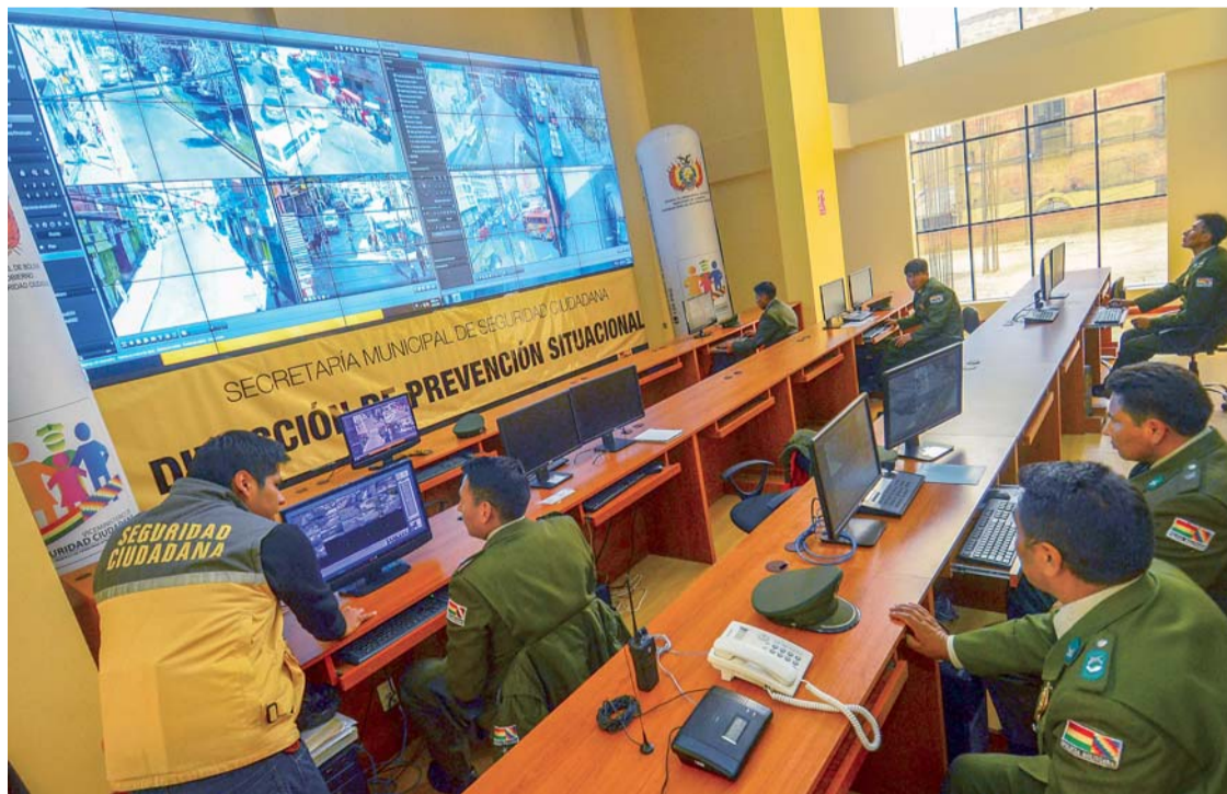
Centro avanzado de monitoreo en La Paz