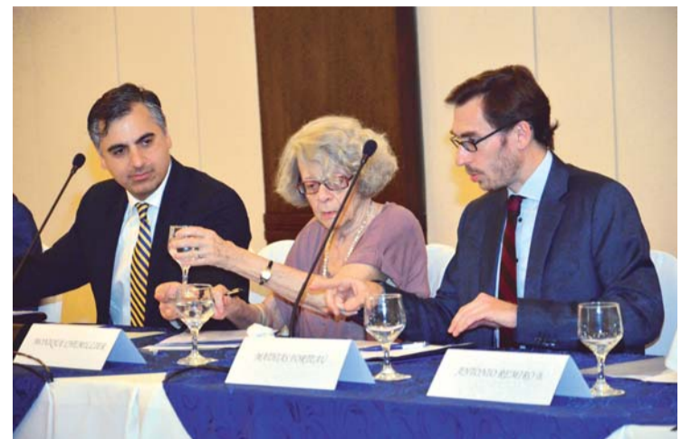
EQUIPO JURÍDICO CONFORMADO POR EXPERTOS INTERNACIONALES.