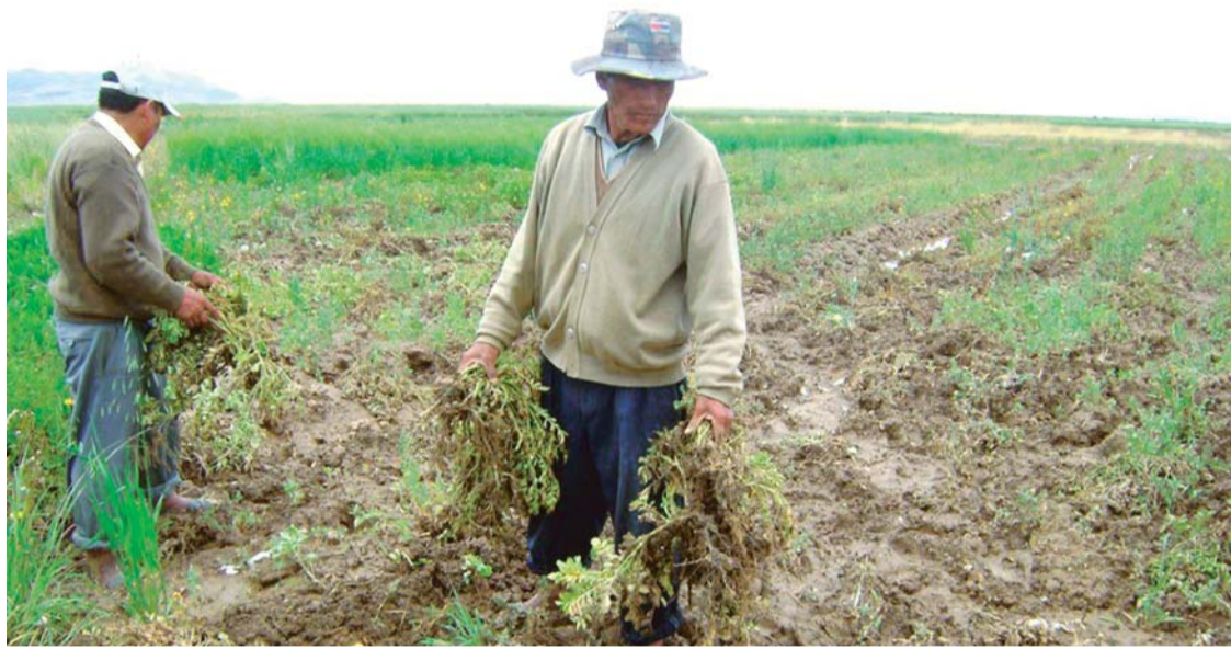
PRODUCTORES DEL OCCIDENTE Y LOS VALLES DE BOLIVIA YA SIENTEN LOS EFECTOS DEL FENÓMENO DE EL NIÑO.

El país dependerá de mayores importaciones de productos básicos en el futuro, ante la ausencia de políticas de prevención del Gobierno frente al fenómeno de El Niño, aseguró el economista Julio Alvarado. Los