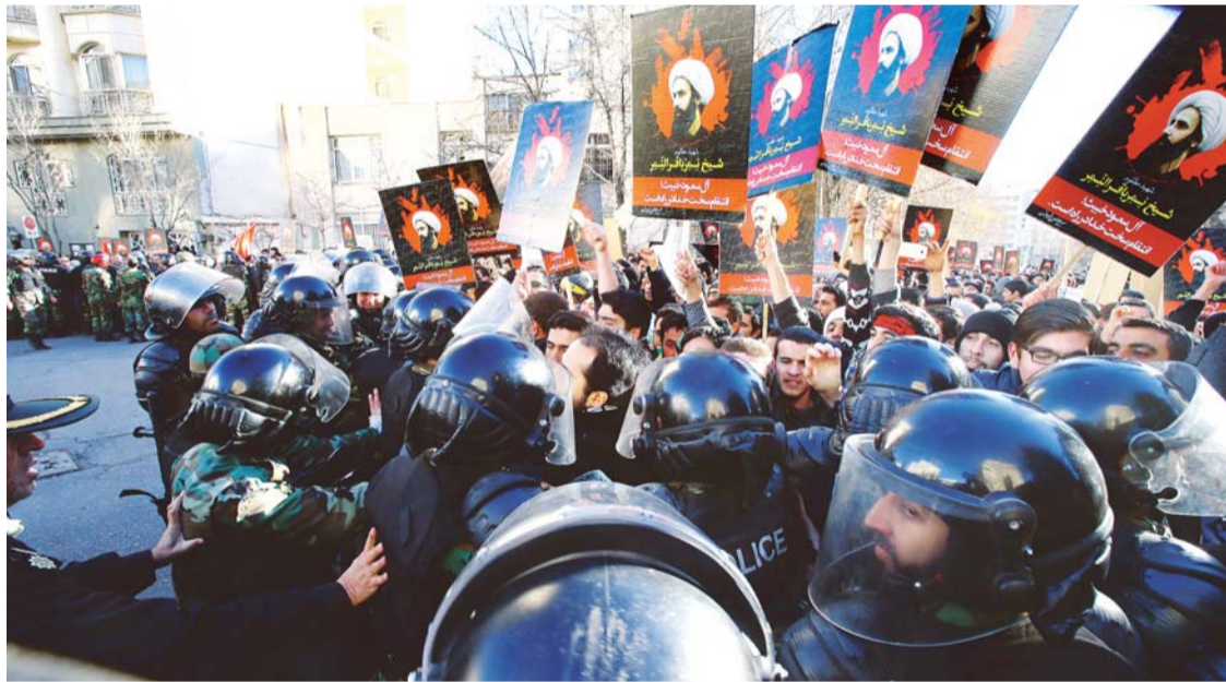
PROTESTAS POR LA EJECUCIÓN DE UN CLÉRIGO IRANÍ ACUSADO DE SER TERRORISTA.