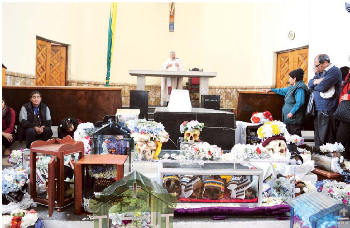
EL DÍA DE LAS ÑATITAS SE REALIZÓ EN LA MAÑANA DE AYER, DOMINGO, EN LA PAZ. EN LA IMAGEN, LOS CRÁNEOS RECIBEN LA BENDICIÓN SACERDOTAL, EN LA IGLESIA DEL CEMENTERIO GENERAL.

Aseguró que "ya se han tomado medidas que están dando sus frutos". Francisco quiso con este mensaje reiterar que nada ni nadie le apartarán de su intención de continuar las reformas en la Curia. (EFE)