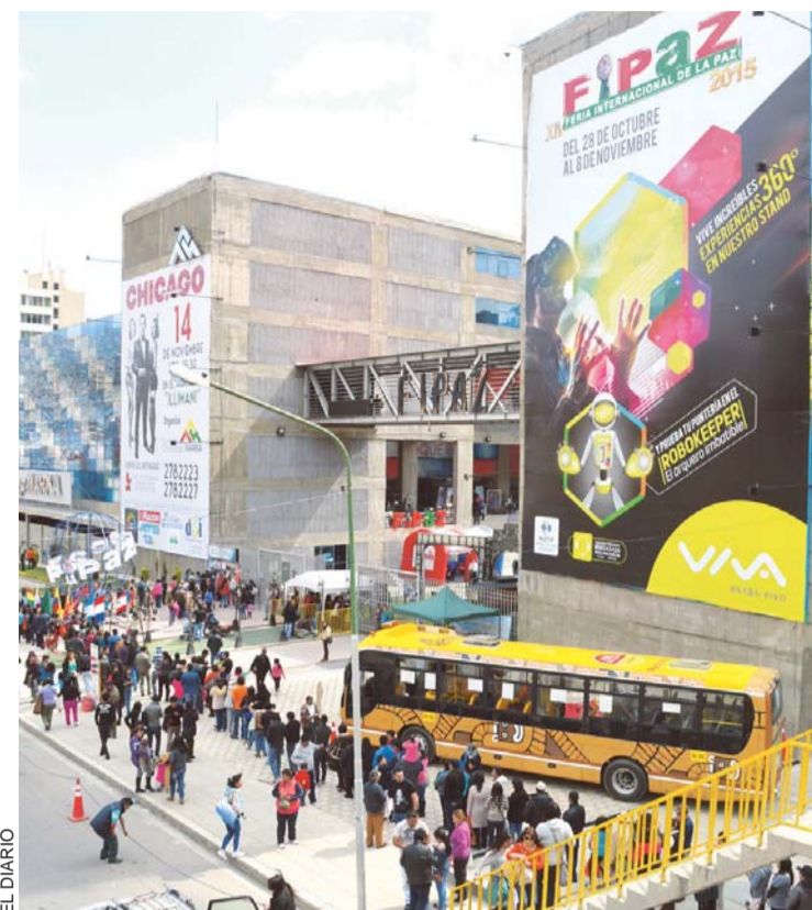
CONCURRENCIA QUE ACUDIÓ A LA ÚLTIMA JORNADA DE FIPAZ. FUE AYER, EN EL CAMPO FERIAL "CHUQUIAGO MARKA".