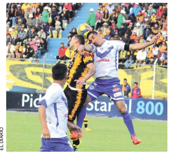
INSTANCIAS DE LOS PARTIDOS DE FÚTBOL DISPUTADOS AYER EN LA PAZ.