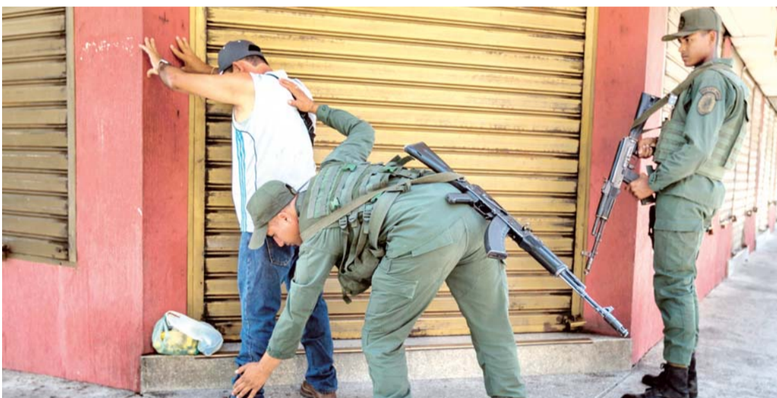
EFFECTIVOS DEL EJÉRCITO VENEZOLANO INSPECCIONAN A UN TRANSEÚNTE CERCA DE LA ADUANA PRINCIPAL FRONTERIZA ENTRE COLOMBIA Y VENEZUELA. LAS DENUNCIAS DE ABUSOS NO SOLAMENTE SON HACIA LAS MUJERES, SINO TAMBIÉN A TODO CIUDADANO QUE CIRCULA POR LA CALLE.

Investigan posibles abusos a colombianos en frontera