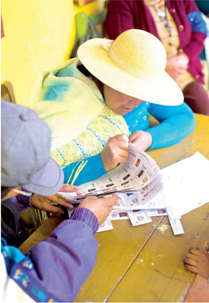
EJERCICIO DEMOCRÁTICO EN EL ÁREA RURAL DE BOLIVIA DURANTE EL ÚLTIMO PLEBISCITO.

• The Economist dice que “La democracia boliviana está caracterizada por elecciones que muestran irregularidades sustanciales, que a menudo impiden que sean libres y justas.”