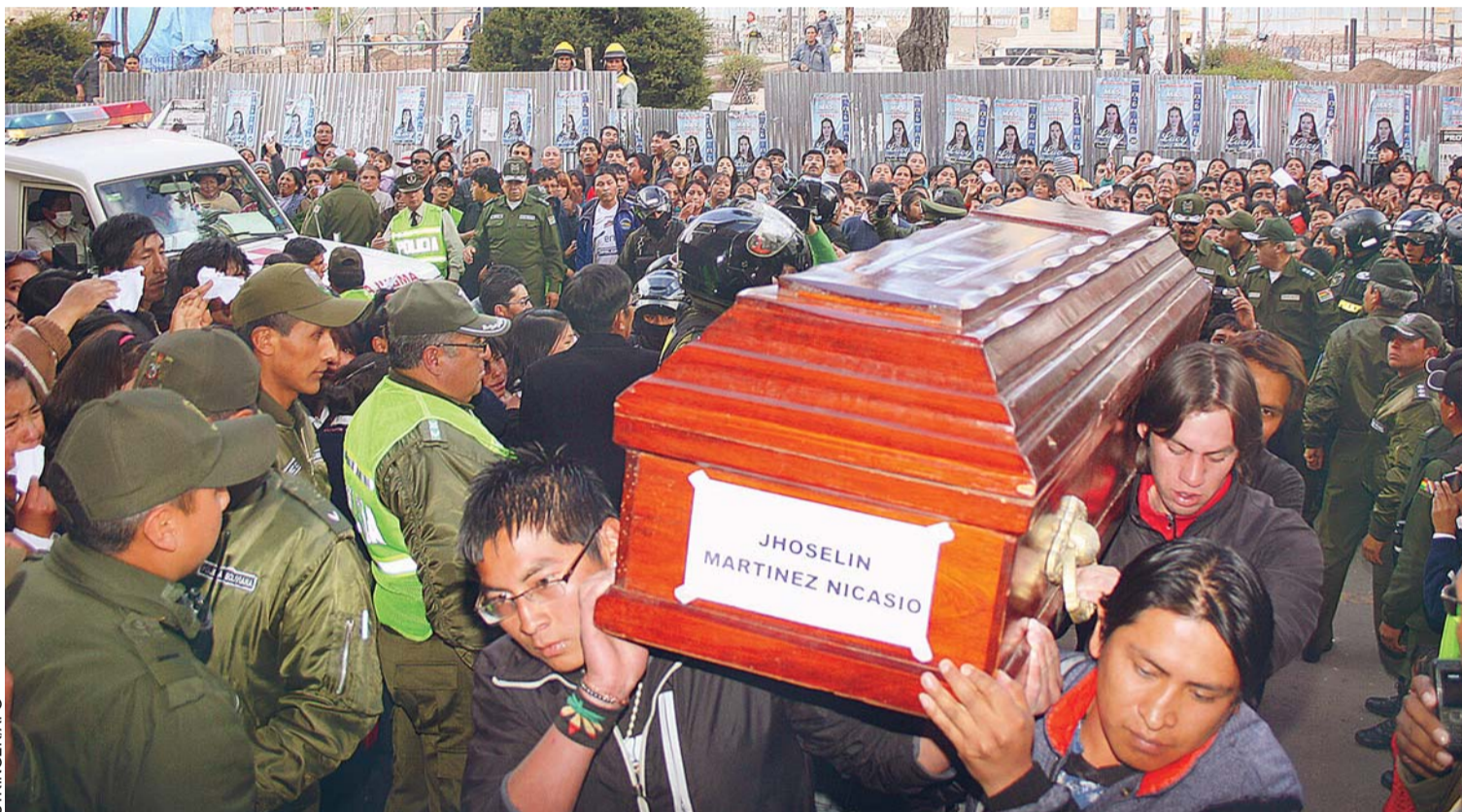
POTOSÍ LLORÓ POR LA PÉRDIDA DE OCHO ESTUDIANTES. CUYOS CUERPOS FUERON TRASLADADOS HASTA EL SALÓN DE LOS ESPEJOS DE LA GOBERNACIÓN, DONDE FUERON VELADOS Y HOY SERÁN ENTERRADOS EN EL CEMENTERIO GENERAL.

En la ciudad de Potosí se vivió escenas de llanto y dolor por la tragedia estudiantil. Los ocho cuerpos de los estudiantes del colegio Oscar Alfaro de la Villa Imperial que se ahogaron en las aguas del río Ichoa de Cochabamba arribaron al aeropuerto Capitán Nicolás Rojas en un vuelo del avión de la Fuerza Aérea Boliviana.