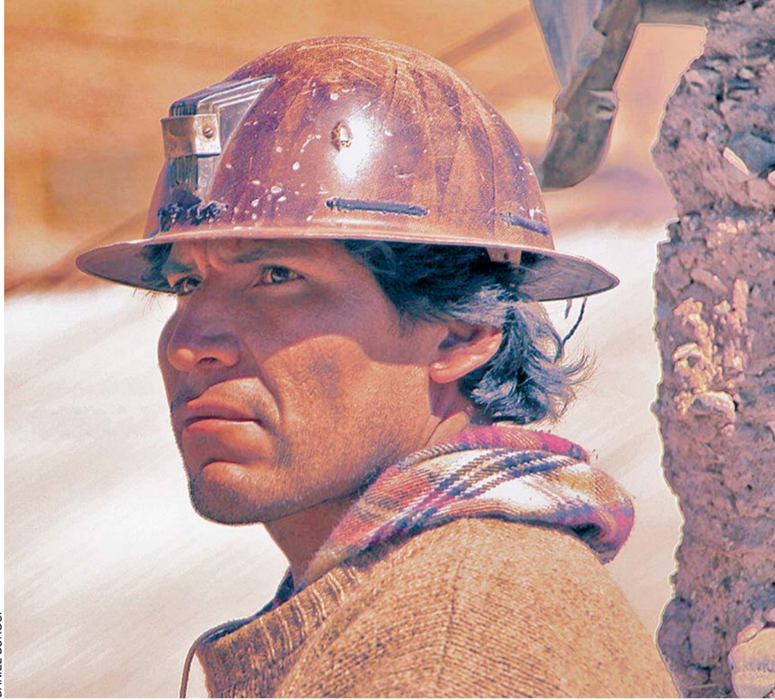
UN PANORAMA INCIERTO SE CIERNE SOBRE LOS TRABAJADORES DEL CENTRO MINERO DE HUANUNI ANTE UN VIRTUAL RECORTE SALARIAL POR LA SITUACIÓN DE CRISIS POR LA QUE ATRAVIESA ESE SECTOR.

Entre enero y marzo de este año, la producción de estaño en la EMH cayó de unas 800 toneladas métricas por día (TMD) a 250 TMD por día, lo que representa el 68,7%.