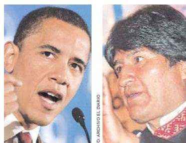
PRESIDENTE BARACK OBAMA