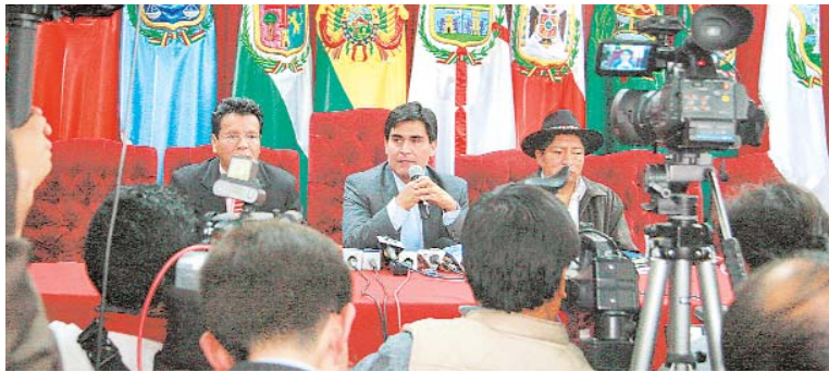
ANALISTA ADVIERTE DISCRIMINACIÓN INFORMATIVA DEBIDO A QUE SÓLO ALGUNOS MEDIOS DE COMUNICACIÓN SERÁN SELECCIONADOS PARA EMITIR LOS PERFILES DE LOS POSTULANTES AL ÓRGANO JUDICIAL.

• Según analista el trato debería ser equitativo, ya que el parámetro de selección es inadecuado.