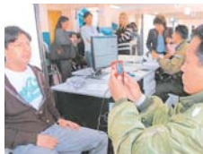
MINISTERIO DE GOBIERNO CONTRA LA IDENTIFICACIONES.