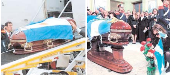
LOS RESTOS DEL EX PRESIDENTE NÉSTOR KIRCHNER FUERON TRASLADADOS AYER A SU NATAL RÍO GALLEGOS, TRAS UNA IMPACTANTE DESPEDIDA EN BUENOS AIRES.