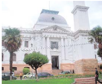
CORTE SUPREMA DE JUSTICIA