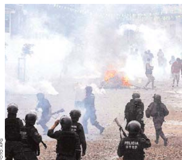
SUCESOS VIOLENTOS REGISTRADOS EN CARANAVI EN MAYO PASADO.