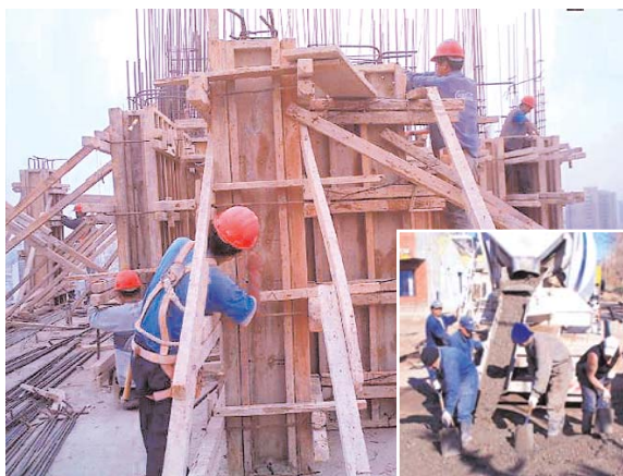
LA ESCASEZ DEL CEMENTO PONE EN RIESGO 200 MIL FUENTES DE TRABAJO EN LA CONSTRUCCIÓN.