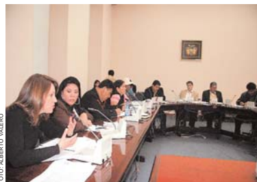
MIEMBROS DE LA COMISIÓN INTEGRADA DE CONSTITUCIÓN Y JUSTICIA PLURAL.

Asimismo, en el párrafo segundo, establece que "se deberá mantener un registro permanente y actualizado de todos los abogados que prestan y prestan asesoramiento jurídico técnico en todas las entidades