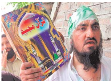
EJEMPLAR DEL LIBRO SAGRADO DEL ISLAM "EL CORÁN".

El pastor de Iglesia cristiana de Florida, Terry Jones, que amenazaba con quemar el libro del Corán el sábado para conmemorar los atentados del 11 de septiembre de 2001, desistió de su intención tras una fuerte presión internacional.