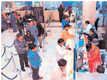
EL SISTEMA DE MICROFINANZAS BOLIVIANO ES MODELO MUNDIAL.

Bolivia ha perdido su condición de líder en el ranking "Microscopio", que cada año realiza el Banco Interamericano de Desarrollo (BID) y la revista inglesa The Economist, debido al incremento de la inseguridad jurídica y la sobreregulación en el sector financiero, males que tienden a agudizarse con las medidas que está tomando el Gobierno central y la autoridad reguladora.