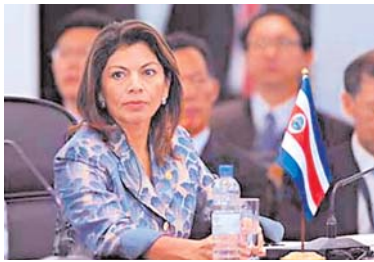
PRESIDENTA DE COSTA RICA, LAURA CHINCHILLA.