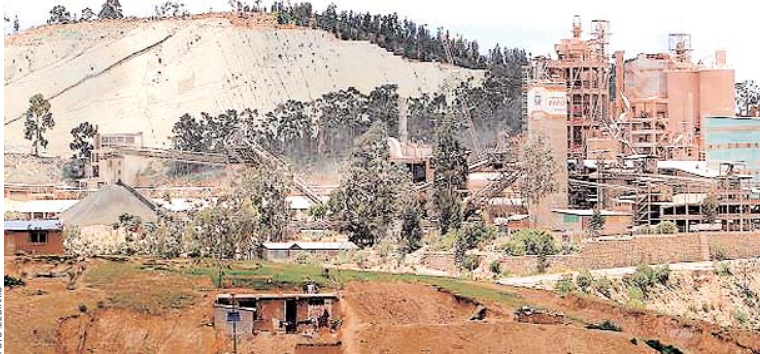
FÁBRICA NACIONAL DE CEMENTO (FANCESA), CUYOS EQUIPOS ESTÁN INSTALADOS EN LA CAPITAL DEL PAÍS.

• La decisión gubernamental es una mala señal para las inversiones nacional y extranjera, según ejecutivo del IBCE.