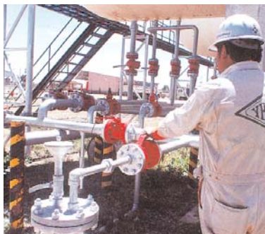
LA PLANTA COMENZARÁ A OPERAR DENTRO DE TRES AÑOS, SEGÚN INFORME DE YPFB.