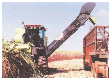
MUJERES Y HOMBRES EMPRENDEDORES BOLIVIANOS DEMOSTRARON QUE NO HAY IMPEDIMENTOS PARA EL QUE REALMENTE DESEA TRABAJAR. AHORA, LOS AGROPECUARIOS PIDEN AL GOBIERNO POLÍTICAS PÚBLICAS SUSTENTABLES.