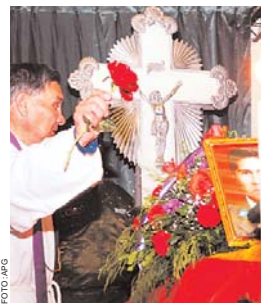
POLICÍA VIGILA A LOS SOSPECHOSOS DEL CASO DE LINCHAMIENTO DE POLICIAS EN UNCIA.