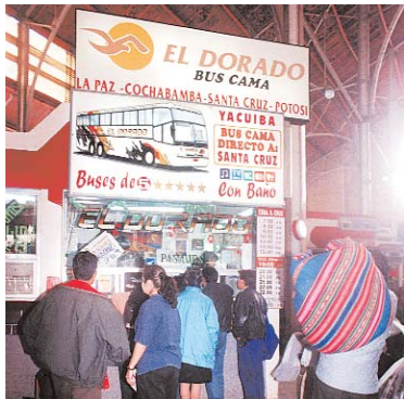
LA EMPRESA DE TRANSPORTE INTERDEPARTAMENTAL "EL DORADO" NO ATENDERÁ A USUARIOS POR EL LAPSO DE UN MES.