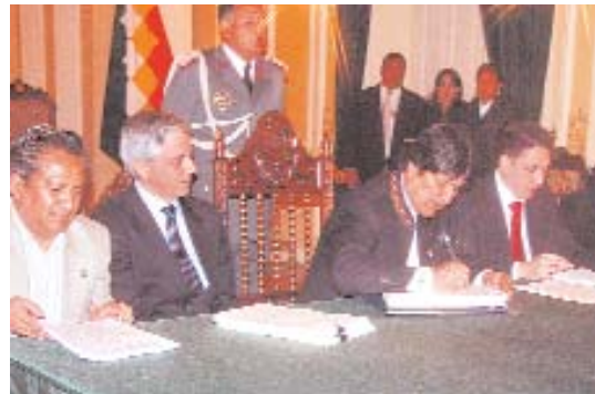
PRESIDENTE EVO MORALES PROMULGA LA LEY DE RÉGIMEN ELECTORAL.

• ANP solicitará al Legislativo rectificar los artículos en cuestión y demandará la inconstitucionalidad de la norma ante instancias internacionales.