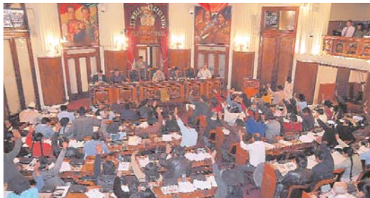
LEGISLADORES DEBATEN EN LA CÁMARA DE DIPUTADOS EL PROYECTO DE ÉTICA QUE BUSCA NORMAR INTERVENCIONES DE PARLAMENTARIOS BAJO SANCION.