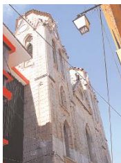
EL TEMPLO DE SAN CALIXTO