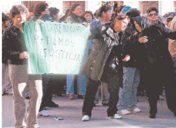
FAMILIARES DE POLICÍAS LINCHADOS EN UNCÍA EXIGEN JUSTICIA A LAS AUTORIDADES ORUREÑAS PARA CASTIGAR COMUNARIOS QUE VIOLARON LOS DERECHOS HUMANOS.