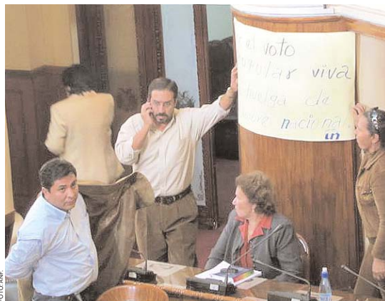
DIPUTADOS DE UNIDAD NACIONAL CUELGAN CARTELES EN EL LA CÁMARA BAJA, APOYANDO LA HUELGA DE HAMBRE DE VARIOS MIEMBROS DE ESA AGRUPACIÓN POLÍTICA.

Partidos opositores que anunciaron acudir a instancias judiciales para revertir las directivas 030 y 031 que redistribuyen escaños en las asambleas, aún no podrán hacer efectiva la medida debido a que la Corte Nacional Electoral (CNE) todavía no emitió una resolución que establezca el rechazo a los recursos de apelación que remitieron las diferentes tiendas políticas afectadas.