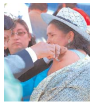
CAMPAÑA ARRANCÓ A ORI-LLAS DEL LAGO TITICACA.

El Ministerio de Salud inició ayer la campaña de vacunación contra la gripe A y otras epidemias en el municipio de Copacabana, la misma que será reforzada a través de 600 brigadas móviles de apoyo. Este movimiento de salud se desarrollará en La Paz, El Alto y áreas rurales. Entre las zonas prioritarias están los municipios con bajas coberturas o de alto riesgo, como las fronteras con la República del Perú y poblaciones de difícil acceso.