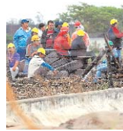
AVASALLADORES TOMAN PREDIOS DE SAN AURELIO.