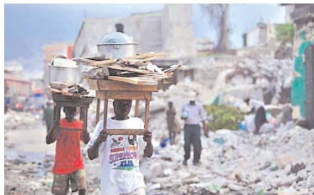
LA POBREZA EN HAITÍ VUELVE A NIVELES EXTREMOS.