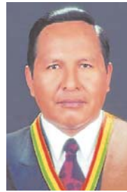
VÍCTOR HUGO CÁRDENAS

Los ex presidentes Jorge Quiroga, Carlos Mesa, Eduardo Rodríguez Veltzé y el ex vicepresidente Víctor Hugo Cárdenas, denunciaron que el presidente Evo Morales pretende someterlos a procesos judiciales, violando sus garantías constitucionales y derechos humanos. Los ex mandatarios manifestaron a tra-