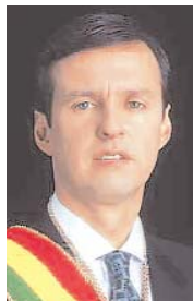
JORGE QUIROGA RAMÍREZ

Quiroga, Mesa, Rodríguez y Cárdenas exigen que la Asamblea establezca en la Ley un recurso efectivo de apelación contra la sentencia condenatoria.