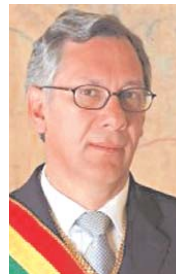
EDUARDO RODRÍGUEZ VELTZE