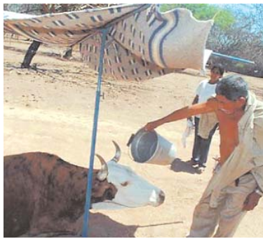
MILES DE FAMILIAS FUERON AFECTADAS POR LA SEQUÍA EN EL TERRITORIO NACIONAL.