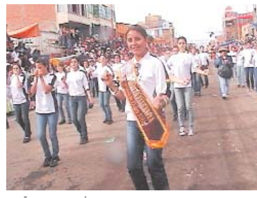
SEÑORITA SIMPATÍA DEL CARNAVAL 2010, REPRESENTA A CAPORALES DE ENAF.