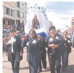
VIRGEN DEL SOCAVÓN O CANDELARIA.