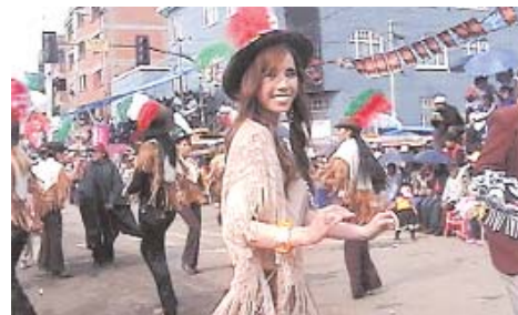
UNA SIMPÁTICA FIGURA DE LA MORENADA FERRARI GUEZZI.