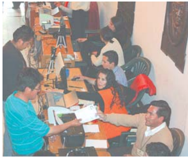
EMPADRONAMIENTO BIOMÉTRICO COMENZÓ EN TODO EL PAÍS.