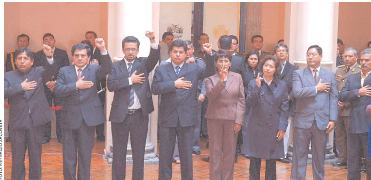
PARTE DEL NUEVO GRUPO DE MINISTROS QUE ACOMPAÑARÁ A EVO MORALES EN EL INICIO DE SU SEGUNDO MANDATO.

• Seis ministros se mantienen en sus cargos, 14 son nuevos; quedaron fuera Juan Ramón Quintana, Wálker San Miguel y Alfredo Rada.