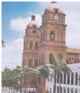
CATEDRAL DE SANTA CRUZ DE LA SIERRA.

(ABI) - El Servicio Geológico de Estados Unidos hizo conocer que ayer en la madrugada se registraron tres sismos en el oriente boliviano de 5,3 grados en la escala de Richter, hecho que fue confirmado por el Observatorio de San Calixto.