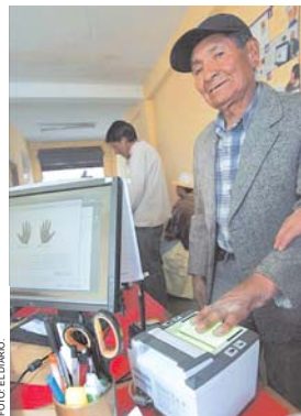
CIUDADANOS SERÁN REGISTRADOS EN EL BIOMÉTRICO A PARTIR DEL SÁBADO 23.