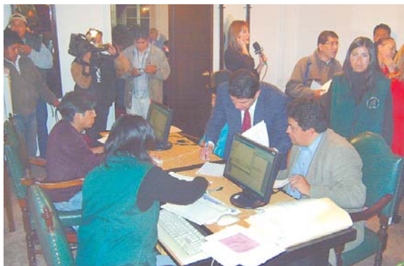
DESAJUSTES EN LISTAS DE CANDIDATOS A PREFECTOS Y ALCALDES CARACTERIZARON EL CIERRE SE INSCRIPCIONES.