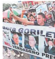
INTENSA CAMPAÑA PARA ELECCIONES DEL DOMINGO.