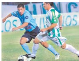
Valioso empate de Bolívar

BOLÍVAR EMPATÓ ANOCHE CON ORIENTE PETROLERO A DOS TANTOS POR LADO EN EL ESTADIO RAMÓN AGUILERA COSTAS DE SANTA CRUZ, EN PARTIDO DEL TORNEO PLAY OFF.