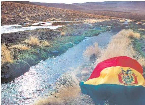
PESE AL PREACUERDO, EL AGUA DEL SILALA FLUYE HACIA CHILE, SIN QUE EL PAÍS VECINO CANCELE NI UN CENTAVO A BOLIVIA.