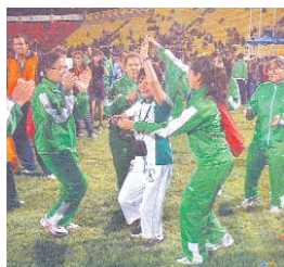
BOLIVIANOS FESTEJAN LA OBTENCIÓN DE 120 MEDALLAS EN LOS XVI JUEGOS DEPORTIVOS BOLIVARIANOS.