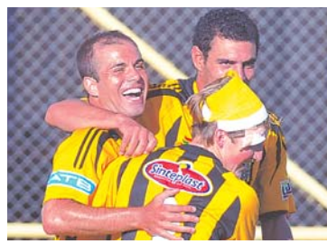
JUGADORES DE THE STRONGEST FESTEJAN LA ÚNICA CONQUISTA DEL ENCUENTRO.

The Strongest pasó a la semifinal del torneo Play Off al ganar ayer al representativo de Aurora por un gol contra cero, en cotejo de vuelta de la liguilla de perdedores, que se jugó en el estadio Félix Capriles, de Cochabamba.