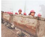
TRABAJADORES AFECTADOS POR EXPLOSIÓN.