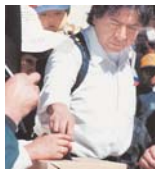
EL EJERCICIO DEL VOTO DEBE SER SIN PRESIONES.

Santa Cruz, (ANF). La Iglesia Católica expresó su férreo apoyo a la democracia y pidió a la población boliviana emitir su voto desde la propia conciencia, bien informada y libre de presiones externas en las elecciones generales del 6 de diciembre próximo.