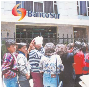
LA FOTO DE ARCHIVO MUESTRA LAS OFICINAS CERRADAS DEL QUE FUERA BANCO SUR EN 1994.