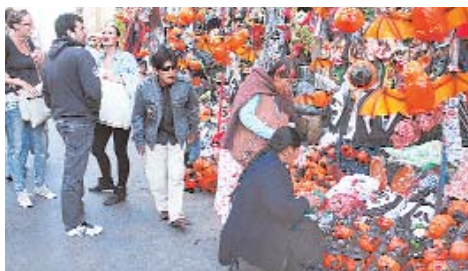
PACENOS SE PREPARAN PARA RECIBIR LA NOCHE DE HALLOWEEN.