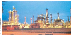
MERCADO URUGUAYO SE BENEFICIARÁ CON GAS BOLIVIANO.

La autoridad adelantó que el novedoso proyecto podría ser financiado por el Banco Mundial (BM), la Corporación Andina de Fomento (CAF) y el Banco Interamericano de Desarrollo (BID).