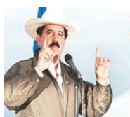
CONTINÚA POLÉMICA ENTORNO A MANUEL ZELAYA Y ROBERTO MICHELETTI EN HONDURAS.

Los manifestantes prácticamente tomaron estos dos aeropuertos, aunque no llegaron a las pista de aterrizaje; invadieron el hall del Aeropuerto Internacional de El Alto y realizaron algunos destrozos, tras lo cual fueron desalojados por efectivos de la Policía Militar. En el aeropuerto Jorge Wilsterman, los empleados de Sabsa declararon huelga de brazos caídos.