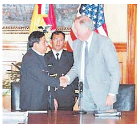
DAVID CHOQUEHUANCA Y THOMAS SHANNON EN UNA REUNIÓN ANTERIOR REALIZADA EN LA PAZ.

Durante el gobierno del presidente George W. Bush, Washington suspendió la ATPDEA tras acusar al gobierno de Bolivia de incumplir su compromiso en la lucha contra las drogas.