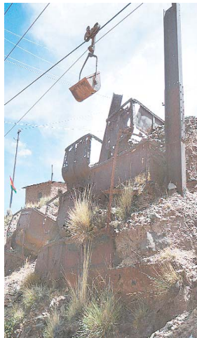
EL COMPLEJO HIDROMETALÚRGICO DE CORO CORO ENTRÓ EN FUNCIONAMIENTO. LAS FOTOS MUESTRAN DOS ASPECTOS: UNA ANTIGUA Y OTRA MODERNA.

• La capacidad de producción del Complejo Hidrometalúrgico para el 2010 se incrementará hasta 5.000 toneladas anuales, según ministro Alberto Echazú.