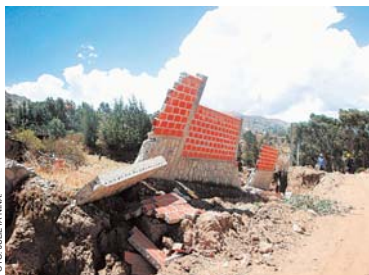
EL DESASTRE EN VILLA SALOMÉ FUE DE PROPORCIONES.

busca "lavarse las manos" y achacar el problema a la empresa Aguas del Illimani, cuando era obligación del Municipio supervisar las áreas de riesgo. "Hace más de 10 años Aguas del Illimani instaló agua potable, pero sin alcantarillado y también hace 10 años el