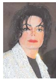
EL REY DEL POP SIGUE DANDO QUE HABLAR.

El doctor Conrad Murray, médico personal del cantante, es objeto de una investigación por homicidio sin premedita-