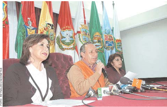
PRESIDENTE Y VOCALES DE LA CORTE NACIONAL ELECTORAL AFIRMAN QUE ALCANZARÁN LA META FIJADA.