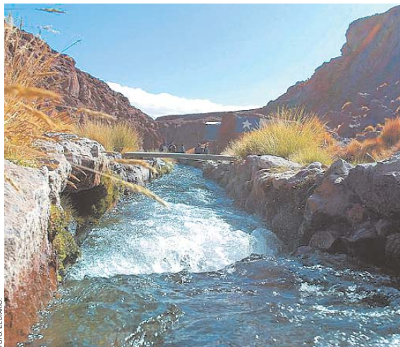
MIENTRAS SE DESARROLLAN PROLONGADAS NEGOCIACIONES, CHILE CONTINÚA CONSUMIENDO AGUA BOLIVIANA SIN PAGAR NI UN CENTAVO, ARGUYENDO QUE SE DEBEN REALIZAR ESTUDIOS.

Tras su viaje a España, la Vocal informó que en ese país se empadronará a 38 mil ciudadanos bolivianos, que viven en las ciudades de Madrid, Barcelona y Valencia en horarios que no perjudiquen sus actividades laborales (18.00 a 23.00 horas).