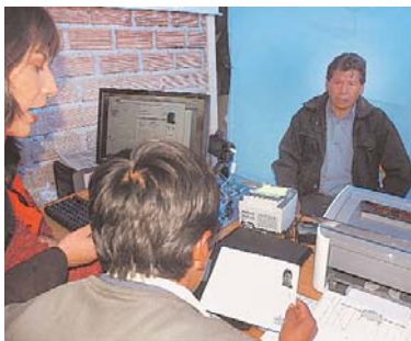
PROCESO DE REGISTRO BIOMÉTRICO CONTINÚA, AUNQUE LA CONCURRENCIA DE LA POBLACIÓN ES MÍNIMA.