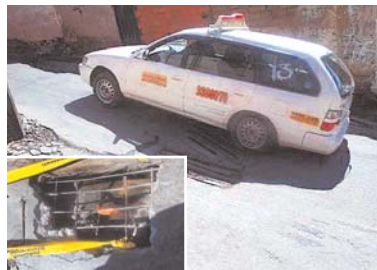
TAPAS IMPROVISADAS PONEN EN RIESGO VIDA DE TRANSEÚNTES.