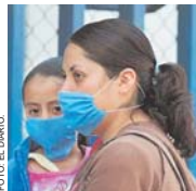
AUMENTAN VÍCTIMAS POR PANDEMIA EN EL PAÍS.