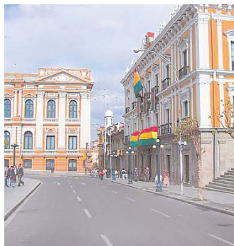
AUTORIDADES DE LOS TRES PODERES DEL ESTADO SE REUNIRÁN EN LA PAZ.