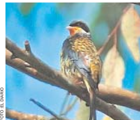
Ave Palcachupa en peligro

PHIBALURA FLAVIROSTRIS BOLIVIANA O AVE PALCACHUPA, ES UNA DE LAS ESPECIES QUE SE UBICA DENTRO DE LA CATEGORÍA NACIONAL EN PELIGRO (EN), DEBIDO A LA PÉRDIDA DE HABITAT, ESPECIALMENTE POR LAS QUEMAS DE BOSQUE.