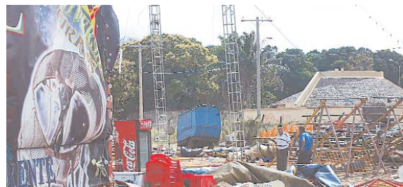
VIENTOS HURACANADOS DE 50, 60, 80 Y HASTA 90 KILÓMETROS POR HORA CAUSARON DESTROZOS DE DIVERSA MAGNITUD EN VARIOS DEPARTAMENTOS DEL PAÍS.