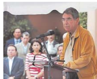
EL PRESIDENTE COSTARRICENSE OSCAR ARIAS BUSCA SALVAR EL DIALOGO HONDUREÑO.