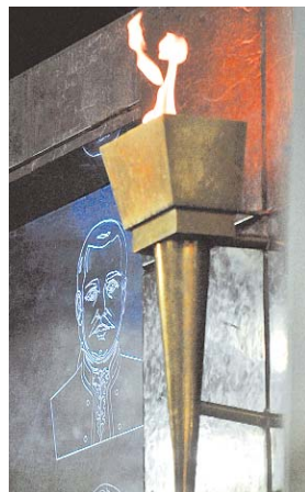
LA TEA QUE DEJÓ ENCENDIDA EL PROTOMÁRTIR PEDRO DOMINGO MURILLO.