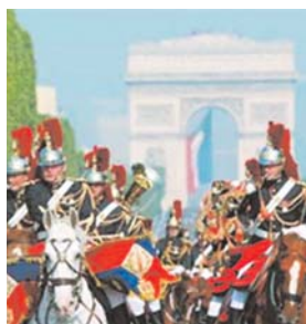
CEREMONIAS DE FESTEJO EN FRANCIA.

También manifestó que Venezuela ya no compra productos debido a una injerencia del gobierno de Hugo Chávez y de su par boliviano, en asuntos privados comerciales.