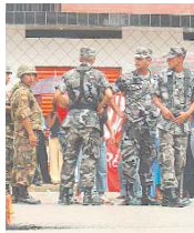
MILITARES CONTROLAN CIUDADES DE HONDURAS.

Los funcionarios europeos reunidos en Bruselas no se pusieron de acuerdo sobre la retirada conjunta de embajadores propuesta por España, con el argumento de que "la situación cambia muy rápido".