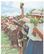
COCALEROS MUESTRAN SU PRODUCCIÓN.

Además, de acuerdo con la versión de los mismos cocaleros,