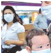
PREOCUPACIÓN ANTE PELIGRO DE PROPAGACIÓN DE LA GRIPE A/H1N1 EN EL ALTO.

Un primer caso de la gripe A/H1N1, registrado en la urbe alteria proveniente de la Argentina, país donde murieron 21 personas a causa del virus de la influenza, fue confirmado por el Servicio Regional