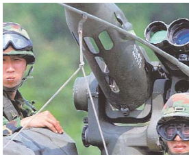
COREA DEL NORTE SE PREPARA PARA ATACAR.

Corea del Norte amenazó ayer en el diario oficialista "Rodong Simmun" a su vecino del Sur con una "abrasadora lluvia de venganza atómica" en caso de una agresión, coincidiendo con el aniversario del comienzo de la Guerra de Corea (1950-1953).