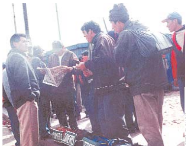
ANTE EL CIERRE DE MERCADOS INTERNACIONALES, EL NIVEL DE DESEMPEÑO EN EL PAÍS AUMENTA DE MANERA ALARMANTE.