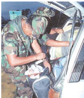
NACIONES UNIDAS PIDE A LA POBLACIÓN A FRENAR LA ADICCIÓN DE DROGAS.

(ANF).- En el Día Internacional de la Lucha contra el Uso Indebido y el Tráfico Ilícito de Drogas, que será celebrada hoy, la Organización de Naciones Unidas (ONU) considera que los países "vulnerables al cultivo, la producción y el tráfico de drogas ilícitas precisan de una mayor asistencia para el desarrollo y del fortalecimiento del estado de derecho".