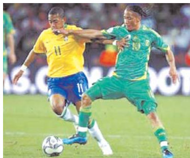
SUDÁFRICA PUSO LA CLARIDAD EN EL JUEGO Y BRASIL LA CALIDAD.