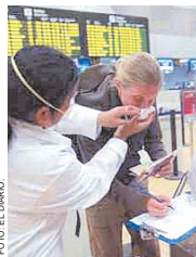
UN NUEVO CASO SE REGISTRÓ EN SANTA CRUZ.