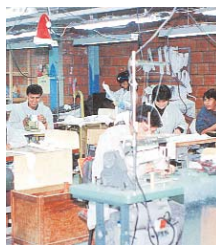
PRODUCTOS BOLIVIANOS EN VENEZUELA.