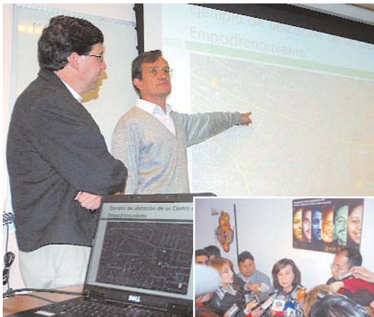
EL ENTE ELECTORAL HA DISPUESTO UN PLAN PARA QUE TANTO EL ÁREA URBANA COMO EL ÁREA RURAL SEAN CUBIERTAS.