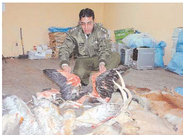
PIELES CONFISCADAS POR LA POLICÍA.