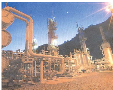
TRES PAÍSES SUDAMERICANOS YA NO QUIEREN DEPENDER DEL GAS BOLIVIANO.