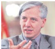
ALVARO GARCÍA LINERA

El vicepresidente de la República, Alvaro García Linera, reiteró que Bolivia cuenta con suficiente material para demostrar las irregularidades en torno al desvío de las aguas del río Mauri; sin embargo, dijo que hay confianza en resolver el nuevo incidente con Perú por la vía diplomática.