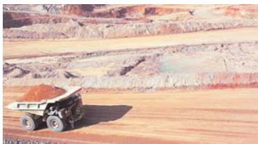
EL MUTUN ES EL PROYECTO SIDERÚRGICO MÁS IMPORTANTE DE AMÉRICA.