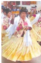
DANZAS FOLKLÓRICAS BOLIVIANAS.

Con el propósito de preservar y difundir la cultura boliviana, doce fraternidades de residentes bolivianos en Estados Unidos bailarían en la nueva versión de la Entrada de "Jesús del Gran Poder" en el Condado de Queens, New York.