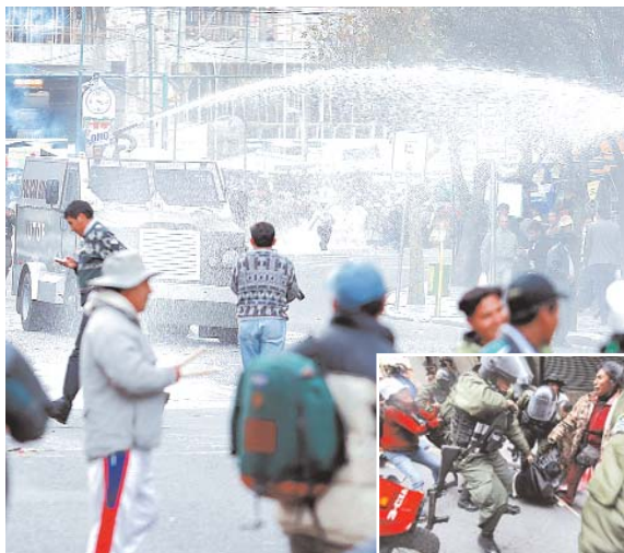
CIENTOS DE COMERCIALIZADORES DE PRENDA A MEDIO USO, QUE BUSCAN QUE EL GOBIERNO AMPLIE LA VENTA DE LA ROPA USADA, FUERON DISPERSADOS VIOLENTAMENTE POR EFECTIVOS POLICIALES CON AGENTES QUÍMICOS Y AGUA DEL CARRO ANTIMOTINES DENOMINADO "NEPTUNO".