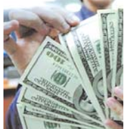
LA POBLACIÓN OPTA POR DEPÓSITOS EN DÓLARES