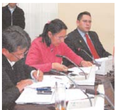
COMISIÓN DE JUSTICIA DE DIPUTADOS.