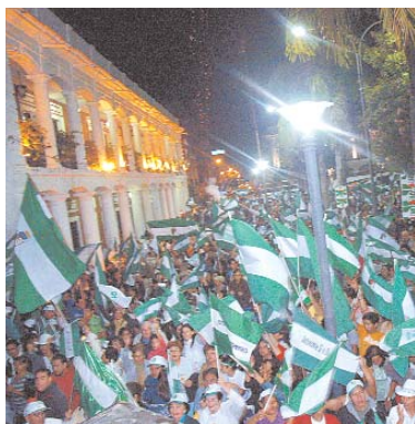
LA POBLACIÓN CRUCEÑA CONDENA LA ACTITUD DEL GOBIERNO NACIONAL, POR PRETENDER AMEDRENTAR A LOS LÍDERES AUTONOMISTAS.