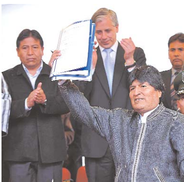
EL VICEPRESIDENTE ALVARO GARCÍA LINERA ENTREGÓ AL PRESIDENTE EVO MORALES LA NUEVA NORMA APROBADA A LAS 4.08 HORAS DEL MARTES EN UN ACTO PÚBLICO REALIZADO EN LA PLAZA MURILLO.