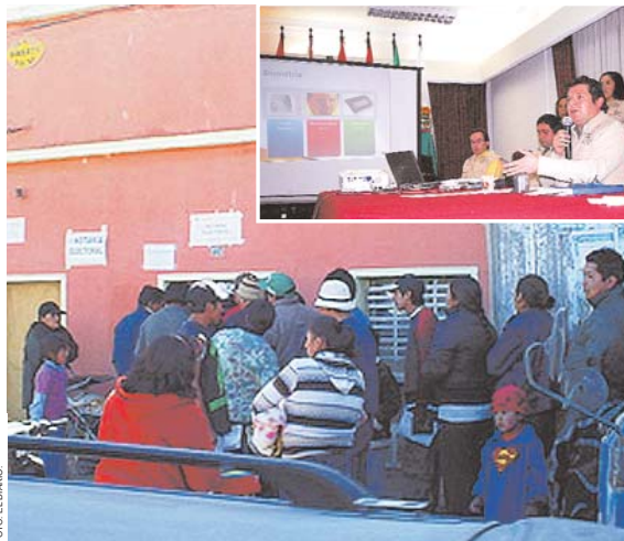
EL PRESIDENTE DE LA CNE, JOSÉ LUIS EXENI, INFORMÓ QUE EL ÓRGANO ELECTORAL TENDRÁ LISTO EL CALENDARIO EN LAS PRÓXIMAS HORAS PARA CUMPLIR CON LA NORMA RECIENTEMENTE PROMULGADA, Y ASÍ, GARANTIZAR ELECCIONES EN DICIEMBRE Y ABRIL DE 2010.