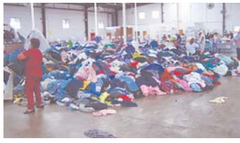
LA ROPA USADA CONTINÚA GENERANDO POLÉMICA, DEBIDO A LA PRETENSION DEL GOBIERNO DE APOYAR A LOS IMPORTADORES.

Una comisión conformada por microempresarios, autoridades de Gobierno y comercializadores de ropa usada evaluará y determinará la ampliación de venta de este producto en el territorio nacional, pese a los efectos negativos que provoca a la industria boliviana.