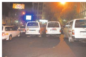
MINIBUSES CONVIERTEN A LA "PLAZA DEL ESTUDIANTE" EN PUNTO DE PARADA DE AUTOTRANSPORTE.