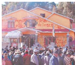
PROPIEDAD DE VÍCTOR HUGO CÁRDENAS EN HUATAJATA.