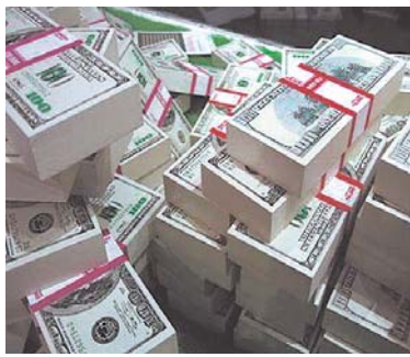
LA COYUNTURA ECONÓMICA A ESCALA MUNDIAL ES NEGATIVA, HA PROVOCADO DESPIDOS MASIVOS Y CIERRE DE EMPRESAS.