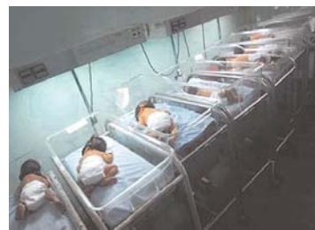
CADA NIÑO PESÓ ENTRE 1,47 KILOGRAMOS Y 680 GRAMOS Y LOS DOCTORES LOS IDENTIFICARON EN UN PRIMER MOMENTO POR LETRAS, DE LA "A" A LA "H".