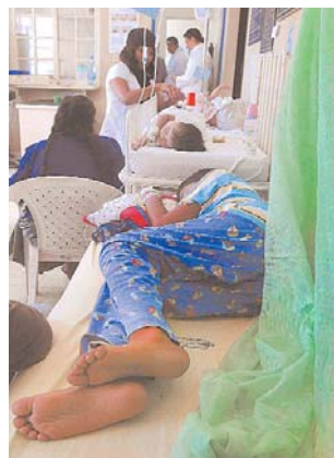
LA EPIDEMIA DE DENGUE, PROPAGADO POR EL MOSQUITO ANÓFELES, SUPERA LOS 5 MIL CASOS EN TODO EL TERRITORIO NACIONAL. CONTINÚAN CAMPAÑAS DE FUMIGACIÓN.