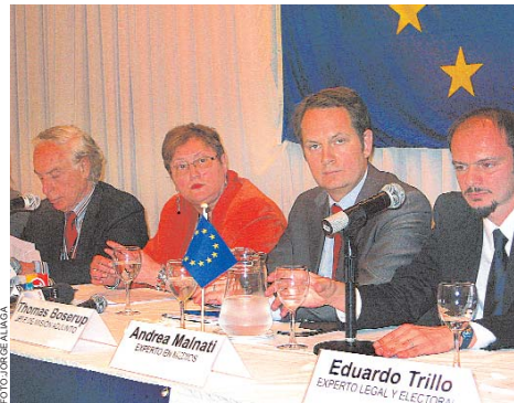
PRINCIPALES REPRESENTANTES DE LA MISIÓN DE OBSERVADORES DE LA UNIÓN EUROPEA.