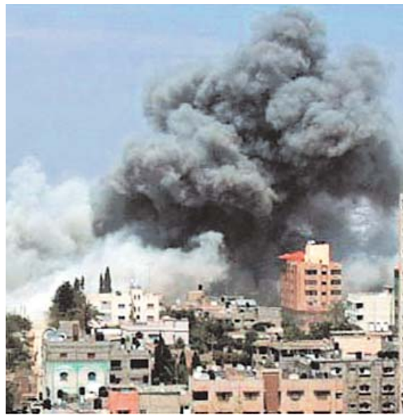
ISRAEL ATACÓ SEDE DE LA ONU, CRUZ ROJA Y PRENSA EN LA FRANJA DE GAZA.