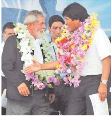
LOS PRESIDENTES LUIZ INACIO LULA DA SILVA Y EVO MORALES SE REUNIERON EN PRIVADO PARA CONVERSAR SOBRE LA MARCHA DE LOS PROYECTOS CONJUNTOS.

Por otro lado, el Presidente de Brasil aconsejó a su homólogo boliviano que gobierne para todos y no pelees con los medios de comunicación. Además, "Paciencia" fue la frase que repitió el Mandatario brasileño dirigido a Evo Morales, durante su alocución en Puerto Quijarro.