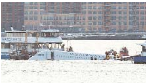
DECENAS DE PERSONAS HAN SUFRIDO HIPOTERMIA Y HERIDAS MENORES.

En este período fueron aprobados en total 161 leyes, dejando pendientes al menos 100 proyectos de ley, por lo que el vicepresidente Álvaro García Linares pidió a los congresistas continuar con el trabajo en la siguiente gestión legislativa que se iniciará el jueves 22 de enero. Asimismo, hizo un llamado especial a los partidos con representación parlamentaria para que mediante el diálogo y la concertación se puedan viabilizar todo lo que se dejó pendiente en la gestión que se clausuró.