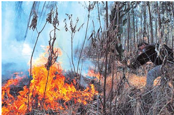
EL 90 POR CIENTO DE INCENDIOS Y FOCOS DE CALOR QUE SE REGISTRARON FUERON MITIGADOS POR LAS PRECIPITACIONES PLUVIALES.