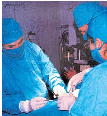
ALGUNOS MALOS MÉDICOS Y ENFERMERAS MUESTRAN UNA ACTITUD INDOLENTE FRENTE A LOS PACIENTES.