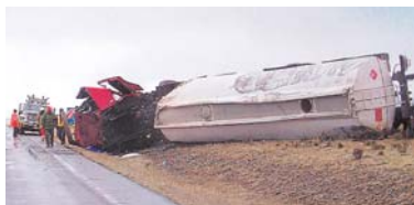
TRÁGICO ACCIDENTE EN CARRETERA PATACAMAYA-TAMBO QUEMADO.