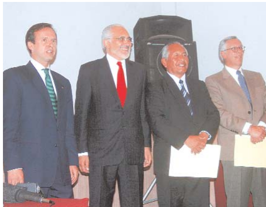
EX MANDATARIOS OBSERVARON QUE 5 DE LOS 12 MIEMBROS DE LA CORTE SUPREMA, ASÍ COMO TODOS LOS INTEGRANTES DEL TRIBUNAL CONSTITUCIONAL Y PARTE DEL CONSEJO DE LA JUDICATURA, HAN SIDO DESIGNADOS RECIENTEMENTE "A DEDO" POR EL PRESIDENTE MORALES.

• Según Carlos Mesa, es una "aberración jurídica" impulsar procesos si magistrados son nombrados "a dedo" por el presidente Morales.