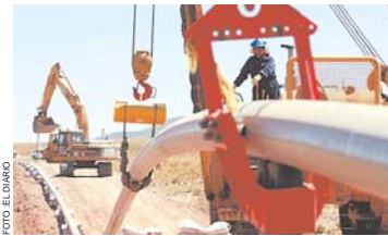
FUNDACIÓN MILENIO RECOMIENDA FORTIFICAR SECTOR HIDROCARBURIFERO.