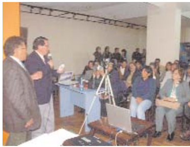
ESPECIALISTAS AFIRMAN QUE EL FLUJO DE LAS AGUAS DEL MANANTIAL SILALA ES CAPTADA POR CANALES ARTIFICIALES HACIA TERRITORIO CHILENO.